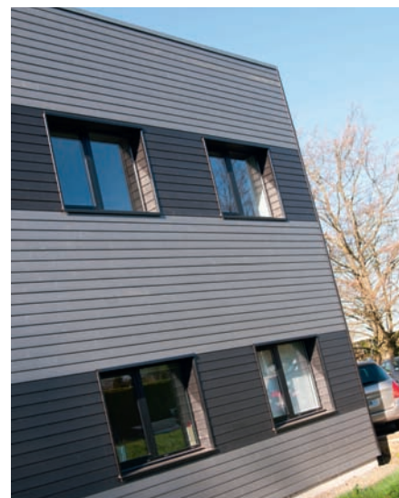
Siège social du Groupe ISB à Pacé (35) habillé d'une Isolation Thermique par l'Extérieur en bardage Silver Lab' Couleur.