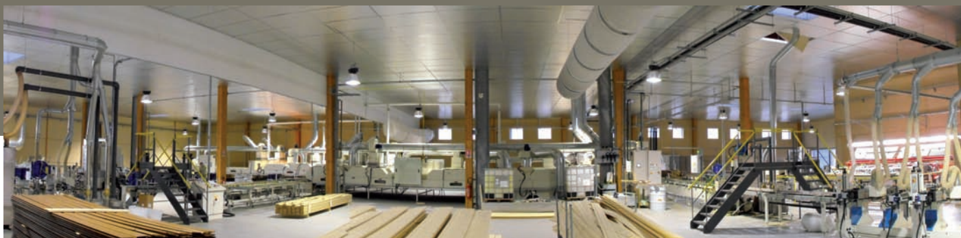
Outil industriel de pointe pour développer les expertises du groupe. Ici, une des chaînes de finition de bardages et lambris du site de Saint-Malo.