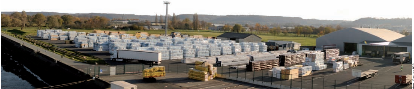
Plate-forme logistique de Honfleur : stock de bois et panneaux pour la vente ou la transformation dans l'un des 7 sites de production.

Reprise d'entreprise par le management dans l'industrie française du bois, celle du Groupe ISB, nouvelle entité forte et autonome qui regroupe les activités de Silverwood, Sinbpla, Carib et James, confirmée en date du 7 avril, à la suite de la cession de Wolseley Plc.