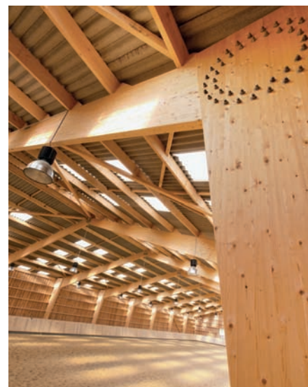
Bâtiment équestre en lamellé-collé fabriqué et construit par James.