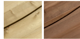
Préservé Vert Préservé Marron