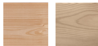
Épicéa Pin Sylvestre